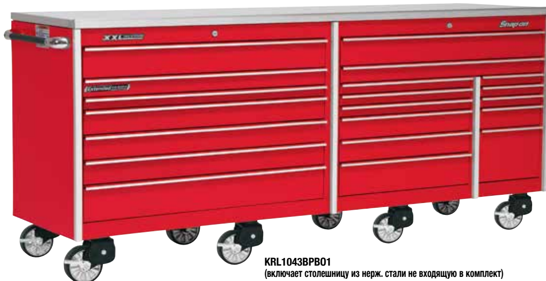
KRL1043BPB01 (включает столешницу из нерж. стали не входящую в комплект)