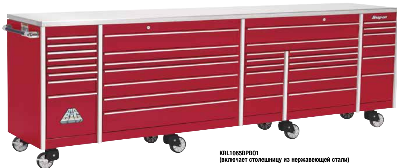
KRL1065BPB01 (включает столешницу из нержавеющей стали)